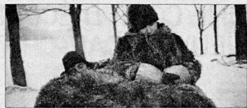
Mon oncle Antoine, un film attachant de Claude Jutra tourné en 1971

UN DIMANCHE À 105 ANS, Prix du public et du jury au festival du cinéma francophone en Acadie (2007) sera également